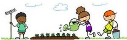
Groetjes, groep 6

Vanaf April worden wij echte boeren en gaan wij beginnen met het planten in ons eigen tuintje.